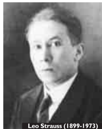
Leo Strauss (1899-1973)

Le lettere tra i politologi, uno in Germania e l'altro negli Usa, mostrano due «anime imparentate» nella critica del post-moderno ma separate dal giudizio sul valore della fede