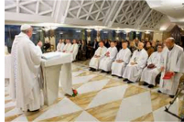
Il Papa: evitiamo di essere "cristiani pipistrelli" che hanno paura della gioia della Risurrezione