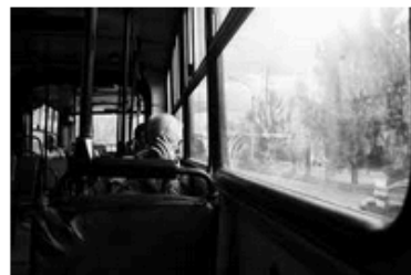
La fatica di vivere