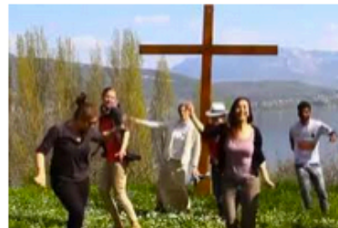
Non riesco a capire in che cosa consista la gioia cristiana: cosa mi sfugge?