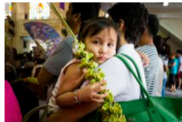
Siamo di stirpe regale