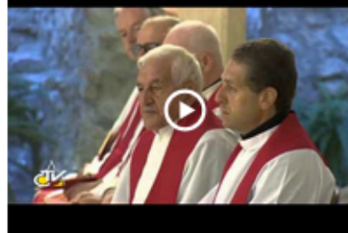
Papa Francesco: la vita cristiana è gioiosa