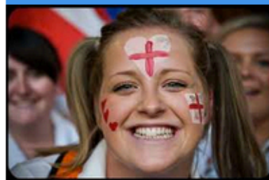
Breve decalogo esistenziale della gioia