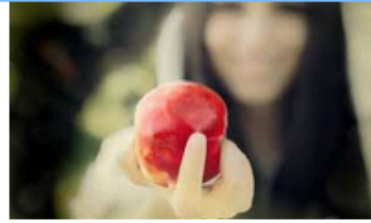
La gioia e la speranza (proemio)

Tutti i proventi del libro sono devoluti al Fondo di solidarietà delle Chiese umbre per le famiglie in difficoltà