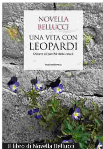
Il libro di Novella Bellucci