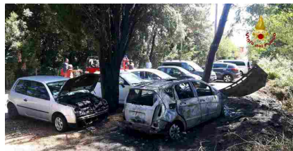
Auto in fiamme a Santa Teresa