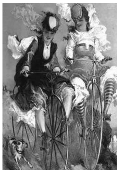
Donne in sella su bicli Michaux

Eppure le donne hanno corso, hanno corso non solo contro rivali e avversarie sui pedali, ma hanno corso soprattutto contro le prevenzioni, contro l'ironia, contro la scienza che le vedeva dedite all'autoerotismo sul sellino. Hanno corso contro la sottomissione, il pregiudizio, la vergogna e lo scherno, pedalando in tandem con la voglia di libertà, in sincronia con le pari opportunità (come è di moda dire oggi...), sulla spinta dell'emancipazione che prima della bicicletta apparteneva a poche elette.