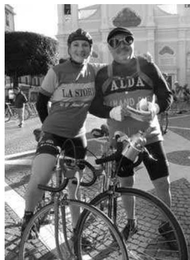
Edita Puciskaite (ex campionessa del mondo) con Carlo Delfino alla Storica, prima tappa del Giro d'Italia d'Epoca

La donna ha da decenni amato la bicicletta come strumento di fatica, di emancipazione e di dignità. Cionfoli sostiene addirittura che la bici è donna, è determinazione, volontà e stile percorrendo quasi duecento anni di storia, producendo documenti frutto di ricerca su consumate riviste dell'ottocento pubblicate anche negli Stati Uniti e in Gran Bretagna, narrando cronache di corse pionieristiche e tratteggiando ritratti che risaltano per la loro spontaneità e voglia di vivere. Purtroppo il ciclismo femminile è ancora di serie B. Come dice il sottotitolo è "figlio di un dio minore".