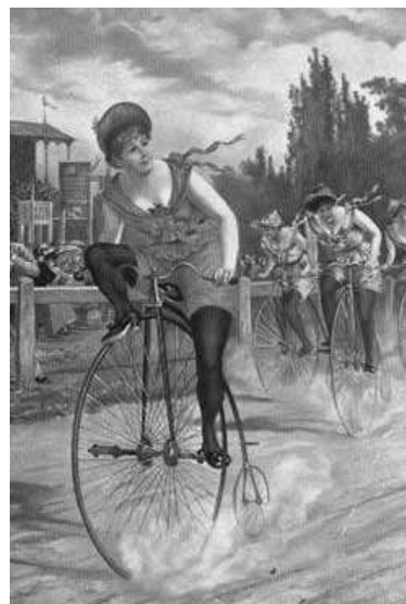
Le prime gare ciclistiche in biciclo