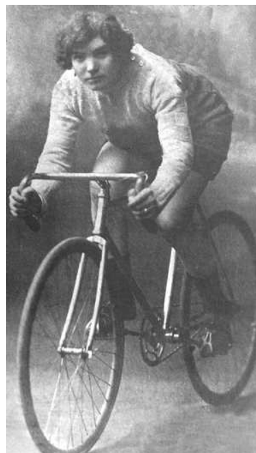
Alfonsina Strada la prima donna al Giro d'Italia del 1924. Trentasei volte vinse gare ciclistiche contro uomini.