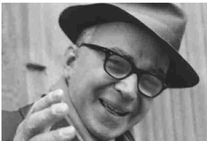
Giorgio La Pira – .

il periodo del soggiorno fiorentino di Buber nel 1905 e 1906, dopo essere arrivato in Italia fresco di dottorato a Vienna con una dissertazione dedicata a Niccolò Cusano e Jakob Böhme. Il secondo indaga il coinvolgimento di Buber nei Colloqui Mediterranei per la pace organizzati fra il 1958 e il 1962 dall'allora sindaco di Firenze Giorgio La Pira (Buber partecipò al secondo, nell'ottobre 1960, e mandò un messaggio al terzo), ma pure in altre iniziative dagli stessi intenti (si veda la lettera inedita in questa pagina con l'invito del sindaco a Buber per avere la sua presenza alla celebrazione fiorentina di un anniversario di fondazione dell'Onu). Il primo tema, dunque, riguarda il rapporto con Firenze, agli occhi di Buber città dell'intreccio tra sapienza razionale e ispirazione religiosa, luogo di raccoglimento al quale si sentiva legato già prima dell'arrivo in Toscana, sin da quando – assistendo a Berlino alle lezioni di Wilhelm Dilthey – si sentiva affascinato dalle città rinascimentali italiane. Il secondo riflette sulla relazione tra il filosofo-teologo austriaco naturalizzato israeliano e il giurista-politico, padre costituente e parlamentare, approvato dalla Sicilia a Firenze dove, vestito l'abito di terziario domenicano in San Marco già nel 1927, si guadagnò fama di santità come primo cittadino per quasi due decenni, già alla fine degli Anni 50, provando a conciliare bisogni dei cittadini e principi cristiani, nonché perseguendo la pace con i già citati "Colloqui".