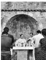
Don Giussani (1922-2005) mentre celebra messa

Quegli undici anni tra il 1954 e il 1965 possono dunque essere letti come un periodo a sé stante. Le sue particolari connotazioni rendono Gioventù Studentesca distinta e differente da Comunione e Liberazione.