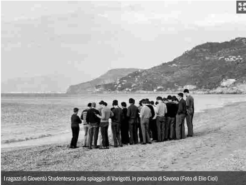
I ragazzi di Gioventù Studentesca sulla spiaggia di Varigotti, in provincia di Savona

La storia di ogni persona è ricca di misteri, perché è un continuo incontro tra la sua libertà e quella degli uomini e delle donne in cui si è imbattuta. Per quanto uno studioso possa applicarsi alla ricerca biografica dei grandi del passato, sempre rimarranno aspetti in ombra suscettibili di nuove indagini. Questo vale a maggior ragione per i santi, quale diventerà don Giussani.