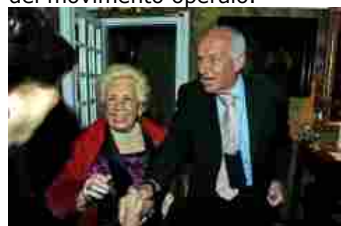
ASSUNTA ALMIRANTE FAUSTO BERTINOTTI

«Le sue parole, che a qualcuno non sono piaciute, ci costringono a riflettere sulla natura del potere. E del resto, cosa sta facendo Bergoglio con la Curia? È il movimento operaio che non si interroga per niente. La distanza tra questi due mondi è drammatica».