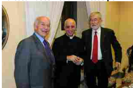
FAUSTO BERTINOTTI RINO FISICHELLA SERGIO COFFERATI

«Bisogna affacciarsi sull' abisso per scongiurare il pericolo. Oggi il rischio di una catastrofe è avvertito solo dalle coscienze più radicali, sociali e religiose. La politica, invece, si è chiusa in una corazza di ovatta che le impedisce di vedere. Quella che avanza è una nuova istanza di dialogo con un mondo che ha tanto da dirci».