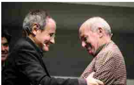
CARRON E BERTINOTTI

«L' eutanasia del movimento operaio ha disperso la memoria di cosa è stato il dialogo con il mondo cattolico». Fausto Bertinotti parte da qui, rievocando il Togliatti del discorso ai cattolici a Bergamo nel 1963 e le esperienze post conciliari degli anni Sessanta, per spiegare in quale contesto nasce il rapporto con Julián Carrón, leader spirituale di Comunione e liberazione.