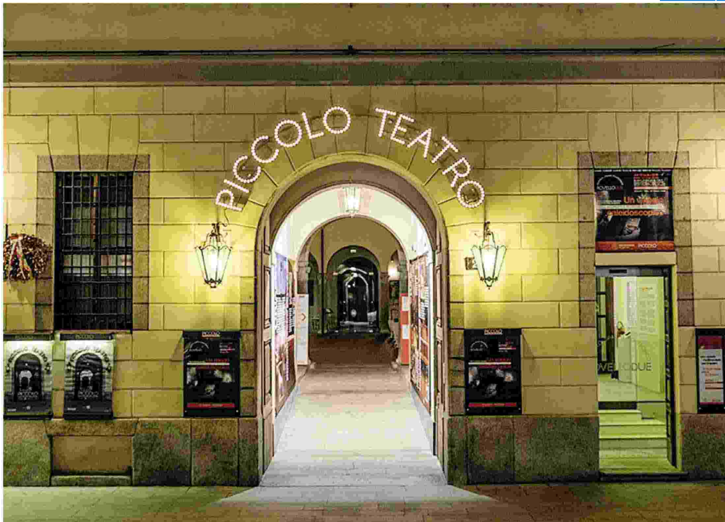
La sede del Piccolo Teatro Grassi a Milano in via Rovello