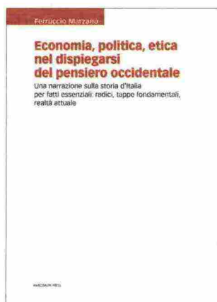
F. Marzano, Economia, politica, etica nel dispiegarsi del pensiero occidentale. Una narrazione sulla storia d'Italia per fatti essenziali: radici, tappe fondamentali, realtà attuale , Marcianum Press, 2019, pp. 608 € 39,00

Il libro, procedendo per tappe essenziali, si propone di fornire un'interpretazione delle vicende della storia d'Italia considerando come e quanto, al dispiegarsi storico degli eventi, hanno contribuito l'economia, la politica e l'etica.