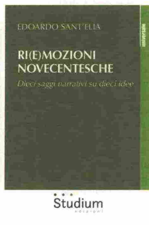
E. Sant'Elia, Ri(e)mozioni novecentesche. Dieci saggi narrativi su dieci idee , Edizioni Studium, 2018, pp. 128, € 13,50

Il volume di Rocco Quaglia, psicologo e psicoterapeuta, nonché docente all'Università di Torino, conduce il lettore attraverso un'inedita riflessione sulla preghiera del Padre Nostro. Tale preghiera continua a sorprendere per la molteplicità dei suoi livelli di lettura e per la profondità della sua lezione. Pur privilegiando