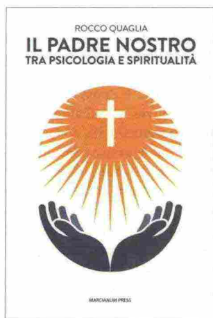
R. Quaglia, Il Padre nostro. Tra psicologia e spiritualità , Marcianum Press, Venezia 2018, € 9,00

Nella prima metà del Saggio, dopo una Parte I destinata a trattare di aspetti di ordine generale, l'autore si propone (Parti II-IV) di fornire un'analisi – sul piano sia teorico che fattuale – degli andamenti, quanto all'Italia contemporanea, ma riandando anche ai loro fondamenti attraverso i secoli, nei tre ambiti dell'eco-