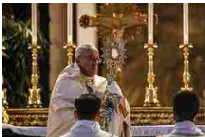
Papa Francesco celebra il Corpus Domini il 18 giugno 2017 a Roma (Ansa)

questa pietà popolare e del suo folklore?