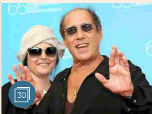
MUSICA | 6 gennaio 2018 Gli 80 anni «molleggiati» di Adriano Celentano