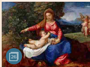
ARTE | 5 gennaio 2018 Una collezione degna di un re