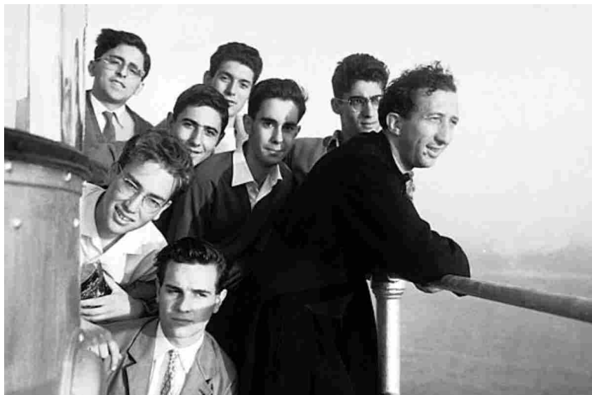
Luigi Giussani (1922-2005) durante una gita al faro di Portofino, nel 1955